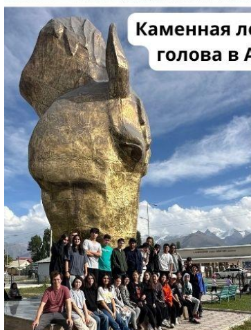
Каменная лошадиная голова в Ат-Баши