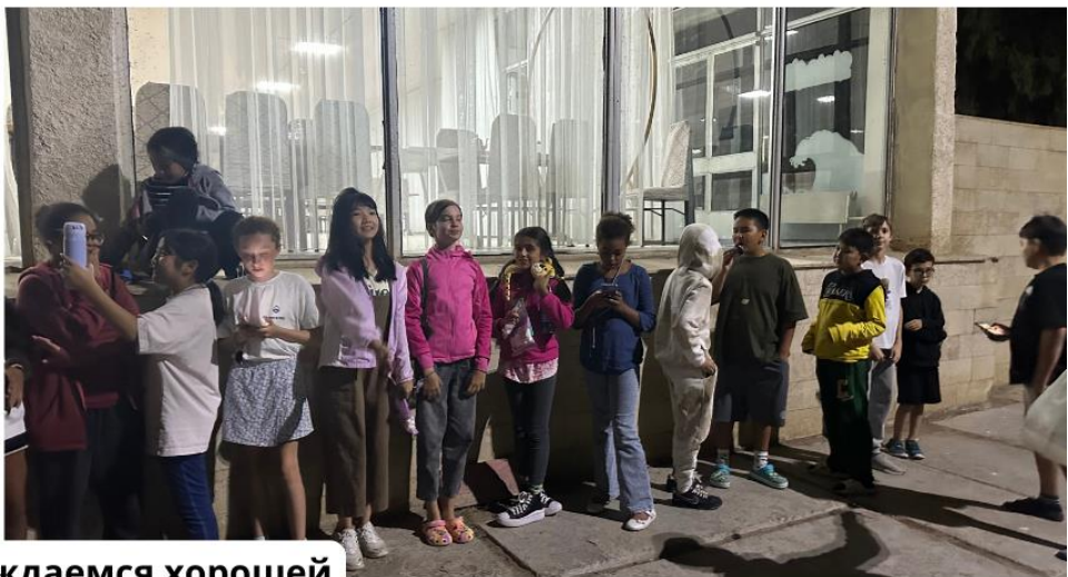
Наслаждаемся хорошей погодой на берегу Иссyk-Куля