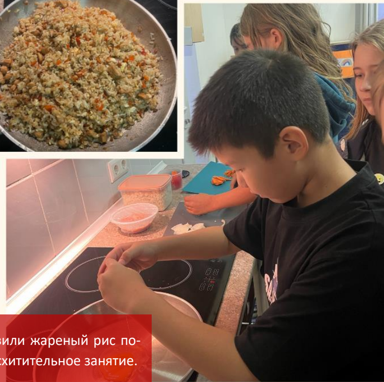
На уроке китайского языка ученики 4 и 5 классов вместе готовили жареный рис по-китайски, воспринимая китайские кулинарные традиции как воспитательное занятие.