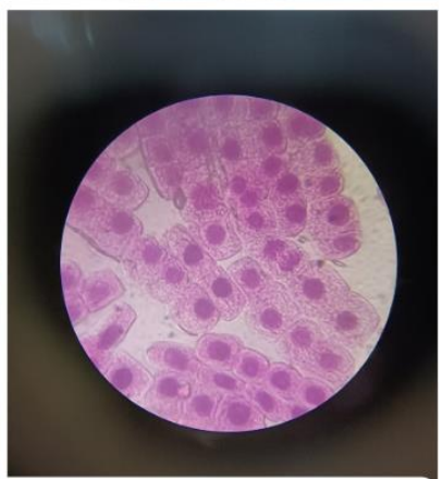
Mitosis in garlic root tip under the microscope.