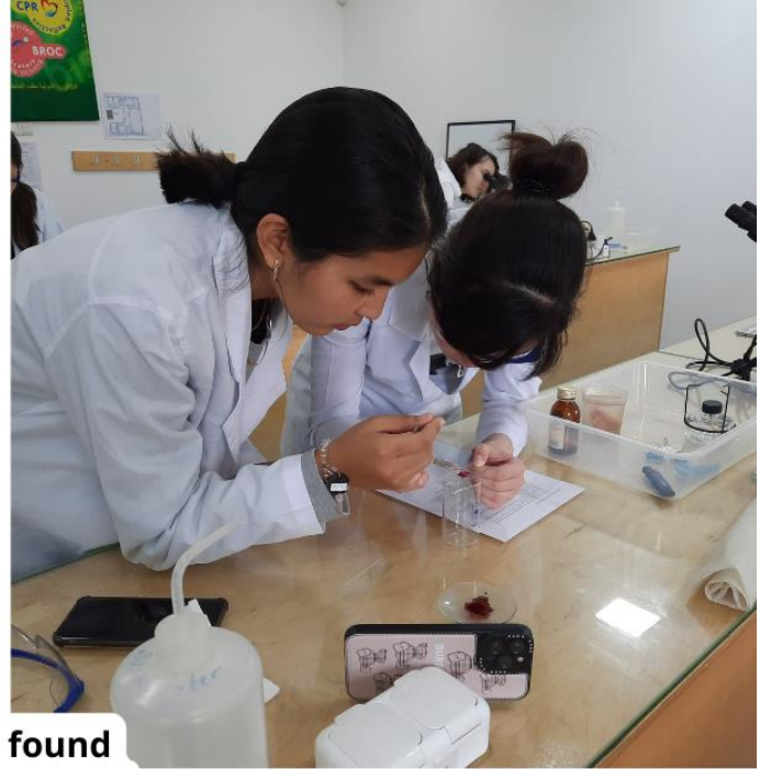
During Biology experiment grade 11 students found mitosis phases of cell division under the microscope.