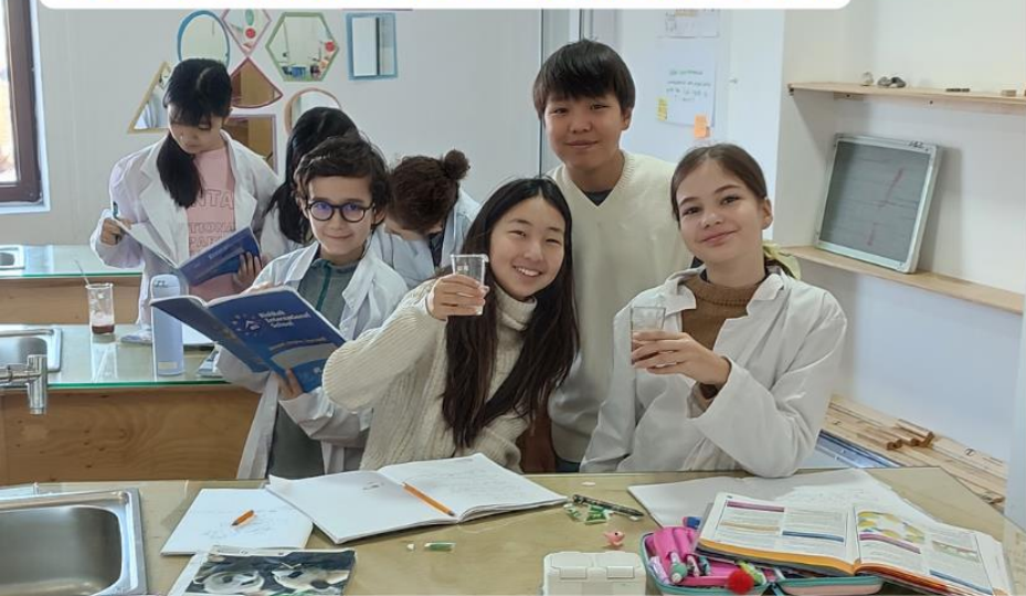
Учащиеся 6-х классов исследуют растворимость различных ингредиентов в шоколадном напитке.