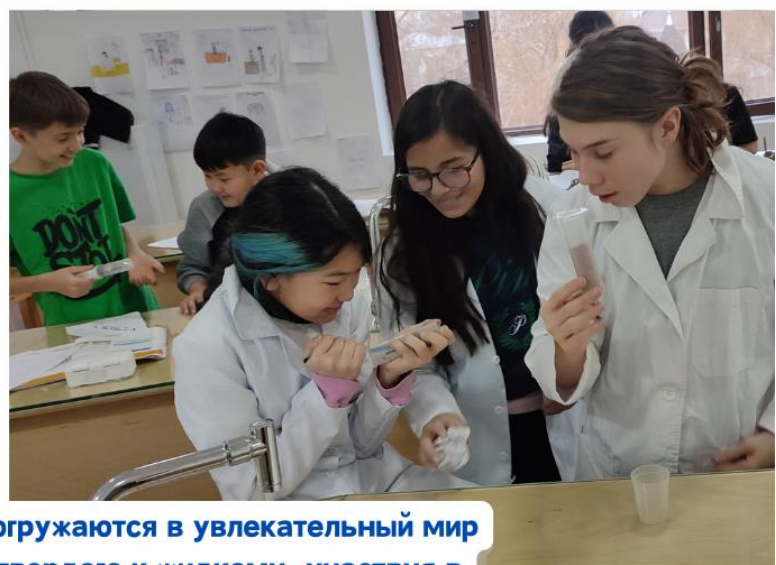
Наши ученики 6 класса погружаются в увлекательный мир изменения состояний от твердого к жидкому, участвуя в завораживающем эксперименте с воском в виде свечи.